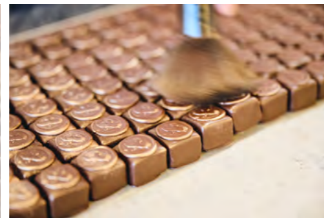
3 Auf Wunsch wird ein festlicher Glanz auf das Praliné gezaubert

Gerne berät Sie unser Fachteam. Preis nach Auftrag.