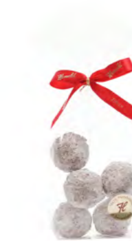
Truffes au Champagne 5 er