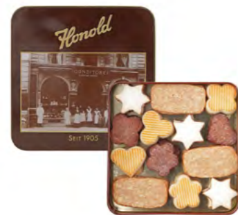
Honold Nostalgiedose Weihnachtskonfekt