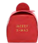
1er Praliné Schachtel Merry X-Mas