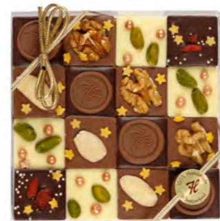
Mendiants Noël 16 er