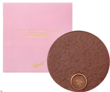
Grand Cru Chakra Lait

Alle Schokoladentafeln werden aus feinsten Grand Cru Chakra Couverture von Hand in ihre traditionelle, runde Form gegossen. Die Plaque Grand Cru Chakra Lait 40% aux Epices de Noël gewinnt jedes Jahr neue Fans.