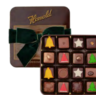
Honold Nostalgie-dose Pralinés Maison