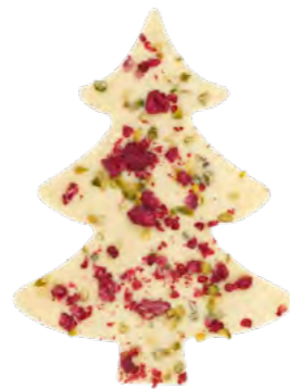
Sapin Framboise/Pistache Blanc 36%