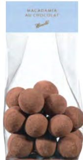
Macadamia au Chocolat

Für ein aussergewöhnliches Geschenk empfehlen wir Chakra Kakaobohnen, sorgfältig geröstet und in feinstem Grand Cru Chakra Lait 40% dragiert. Jede Kakaobohne hat einen eigenen, unvergleichlichen Geschmack.