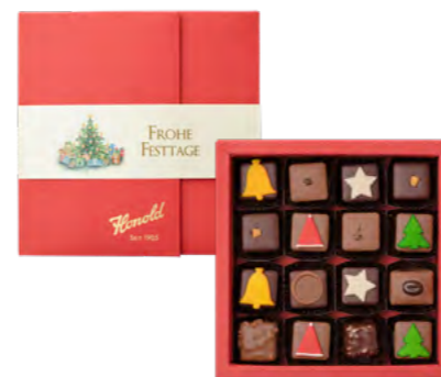
Pralinés Edition Noël

Die Haute Chocolaterie pur! Entdecken Sie unsere Truffles und Pralinés Kollektionen – ob klassisch delikate Ganaches oder Füllungen mit sinnlichen Gewürzen, Karamell oder Nüssen.