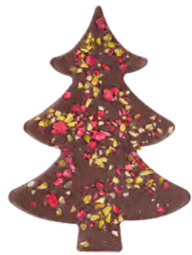
Sapin Framboise/Pistache Chakra Noir 70%