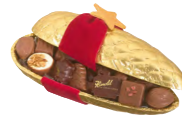
Tannenzapfen mit Pralinés