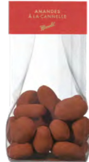
Amandes à la Cannelle