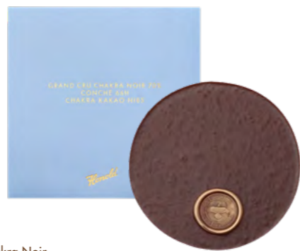
Grand Cru Chakra Noir