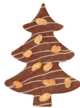
Sapin Cacahouète Chakra Lait 40%