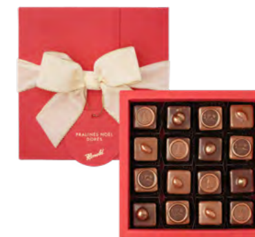
Pralinés Noël Dorés