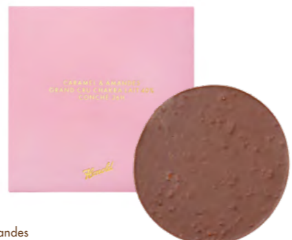
Caramel & Amandes