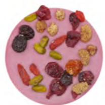
Petite Plaque Ruby