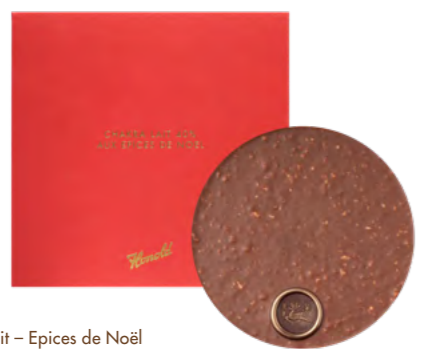
Grand Cru Chakra Lait – Epices de Noël