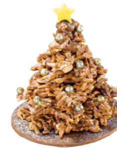
Rocher-Baum Grand Cru Chakra Lait 40%

Weihnachtsklassiker von Honold, welche immer wieder entzücken, sind die Rocher-Bäume und der mit Pralinés gefüllte Tannenzapfen. Beide repräsentieren die Begabung unserer Chocolatiers, sowie die Künste unseres Ateliers. Auch die kleineren Säckchen erfreuen das Herz mit erlesenen Spezialitäten aus alter Tradition.