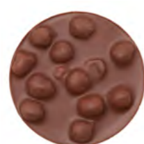
Petite Plaque Noisette Lait