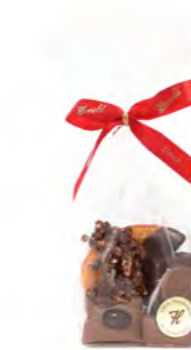
Pralinés Maison 5 er