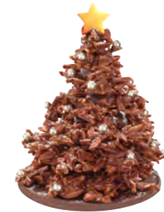
Rocher-Baum Grand Cru Chakra Noir 70%