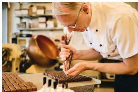
1 Ein Tropfen flüssige Schokolade wird auf jedes einzelne Praliné aufgetragen

Gerne individualisieren unsere Chocolatiers Ihre ausgewählten Pralinés mit Ihrem Logo. Mittels eines speziell angefertigten Siegelstempels wird jedes Praliné sorgfältig von Hand geprägt. Diese Veredelungstechnik eignet sich auch optimal für Mendiants und Schokoladentafeln, um Ihr Branding stilvoll in Szene zu setzen.