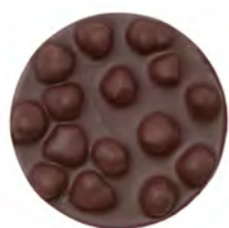
Petite Plaque Noisette Noire