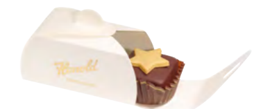
2er Pralinés Edition Noël