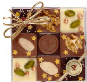
Mendiants Noël 9 er