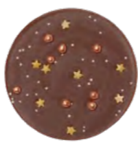
Petite Plaque Noël Lait